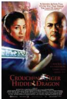
Oscar-winner for film score: "Crouching Tiger, Hidden Dragon"

Dans son CONCERTO POUR PIPA, Dun réalise un étourdissant mariage des traditions et un voyage à travers l'histoire de la musique. L'intégration culturelle s'opère avec aisance. S'il est vrai que le pipa peut s'avérer comme un instrument exotique au sein de la musique occidentale, il n'est cependant plus étranger à nos oreilles. Le Concerto pour pipa s'intègre dans diverses œuvres écrites par Dun dans un format concertant plus traditionnel en vue du Ghost Opera expérimental. Les œuvres de Dun sont jouées de par le monde : de la salle de concert de Avery Fisher Hall, Suntory Hall au Musée Guggenheim. Les compositions de Dun sont à l'affiche de nombreux festivals prestigieux dans le monde et régulièrement diffusées par la National Public Radio, la BBC et la radio de Berlin.